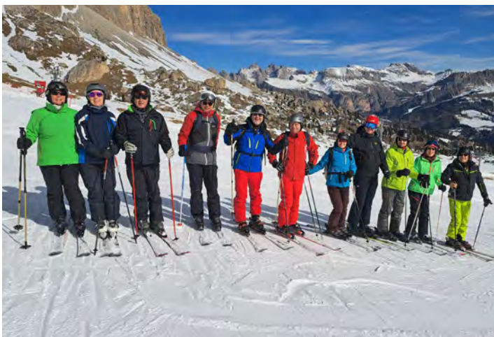
Skifreizeit in Canazei (Italien)