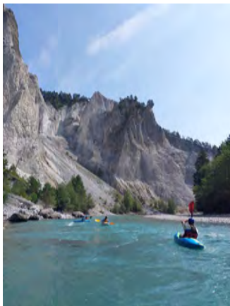
Kanugruppe in Aktion