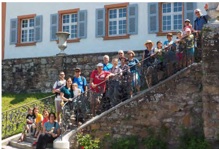
Familiengruppe auf Schloss Bürgeln